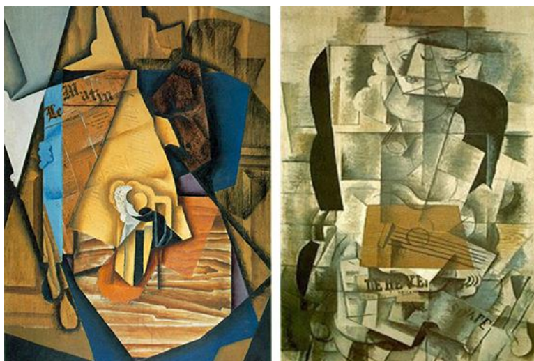
À esquerda, Homem no Café (1914), de Juan Gris. À direita, Mulher com Violão (1908), de Braque