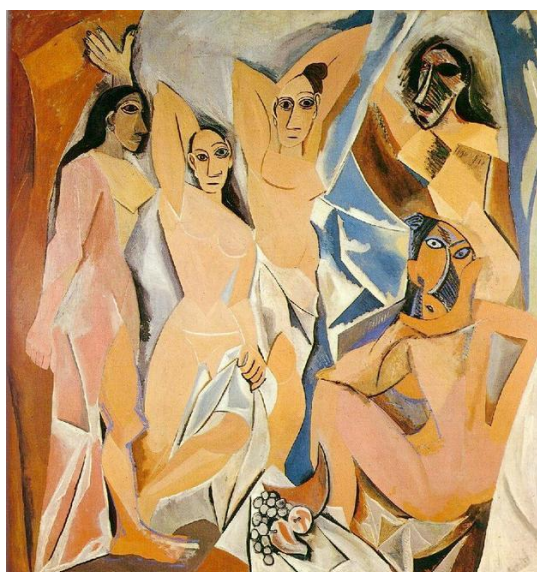
Les Femmes d'Alger (O Grande Baie) (1907) de Pablo Picasso. 244 x 234 cm. MoMa, Nova Iorque

O marco para o surgimento do cubismo foi em 1907, com a tela Les Femmes d'Alger (O Grande Baie) (As damas d'Alger), do pintor espanhol Pablo Picasso.