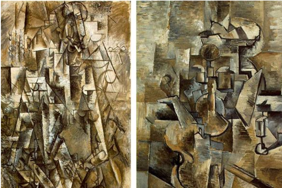
À esquerda, O poeta (1911), de Picasso. À direita, Violino e Castiçal (1910), de Braque.

A fase analítica caracterizou-se pela cor moderada, acentuando-se tons de marrons, pretos, cinzas e ocre. Tal escolha das cores se deu, pois, o mais importante era a exibição do tema fragmentado, disposto em todos os ângulos possíveis. Esse esfacelamento das formas chegou a níveis tão elevados que, ao final, as figuras acabaram por se tornarem irreconhecíveis.